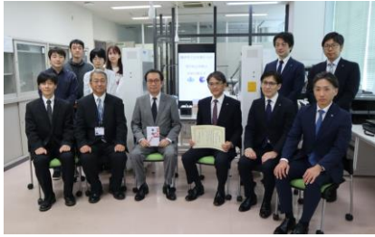
贈与式（熊本高専様にて）